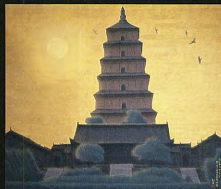
平山郁夫筆「明けゆく長安大雁塔・中国」(「大唐西域壁画」より第1場面)

壮大なシルクロードの世界を生涯のテーマとしていた故平山郁夫先生(1930年6月15日～2009年12月2日 前東京藝術大学学長)が、20年の歳月をかけて完成させた「大唐西域壁画」を中心に回顧する特別展が、2011年1月18日～3月6日まで東京国立博物館にて開催されます。これと相まって、この度、一周忌を迎えた平山郁夫先生の追悼として、オペラ《遣唐使～阿倍仲麻呂～》全4幕を東京藝術大学奏楽堂にて上演いたします。「平城遷都1300年祭」を機として創作されたこのオペラは、奈良・薬師寺玄奘三蔵院の「大唐西域壁画」の前で2009年6月に前編、2010年6月に後編が初演され、今回が全曲版による東京初演となります。